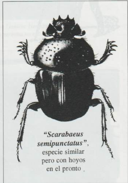
"Scarabaeus semipunctatus", especie similar pero con hoyos en el pronoto.

Es de color negro todo él, con el cuerpo rechoncho y las patas anteriores en forma de rastrillo, que le sirven, junto con la cabeza también espinosa, para excavar la tierra o amontar el estiércol. Las patas posteriores son largas y son éstas las que utiliza para hacer rodar la pelota.