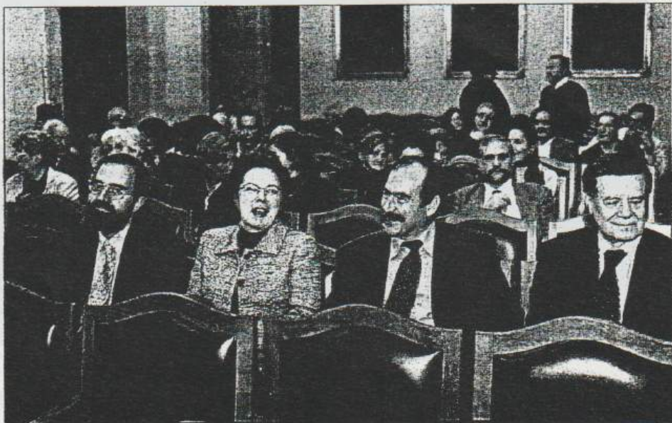
Los asistentes al homenaje a la primera promoción de Filología Moderna.