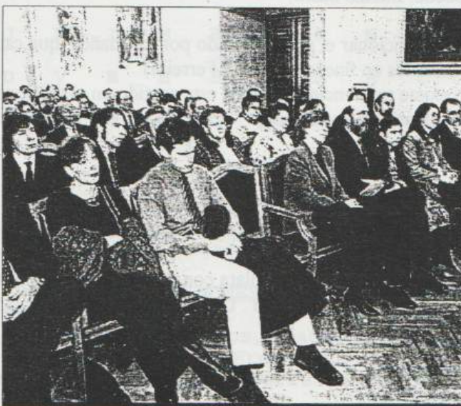
En el acto estuvieron familiares y compañeros.