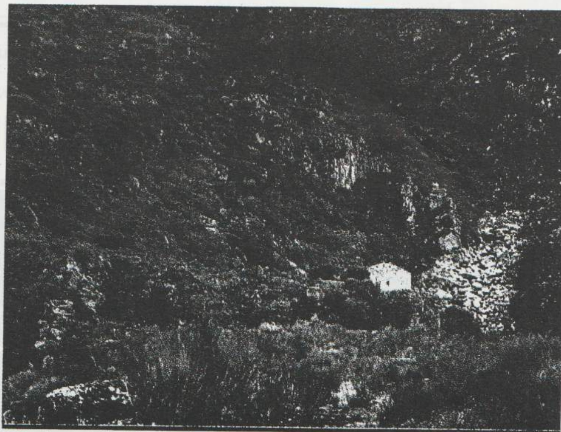
La carretera comunicaría las dos márgenes del Agueda.